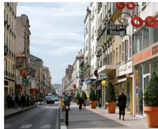
Rue Jean Jaurès