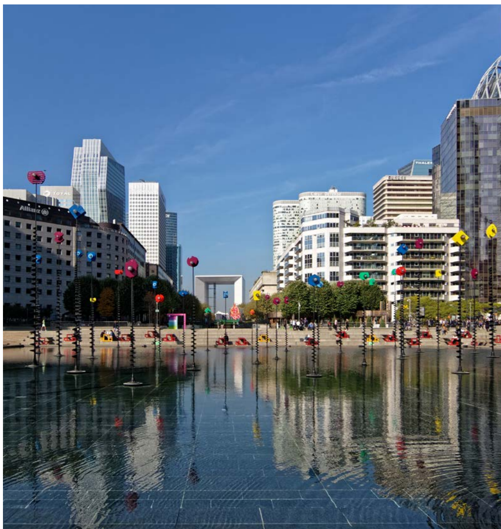
Parvis de l'esplanade de La Défense