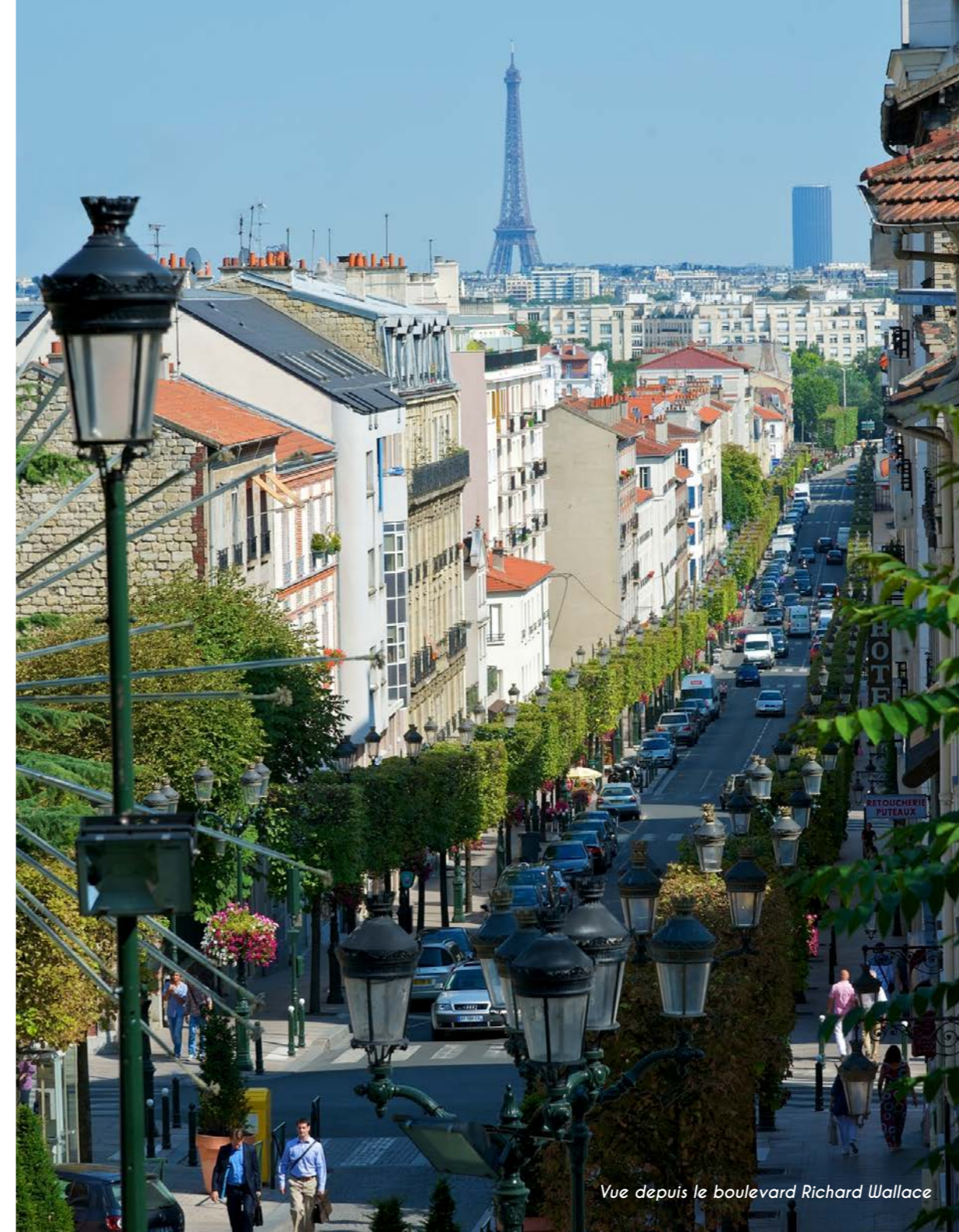
Vue depuis le boulevard Richard Wallace

Sur une large partie de son territoire, le pôle de La Défense, plus important quartier d'affaires d'Europe, accueille des groupes de portée internationale et le centre commercial Westfield Les 4 Temps. Cette ville des Hauts-de-Seine s'assure ainsi un rayonnement économique de premier plan auquel s'ajoute une desserte stratégique par la ligne 1 du métro, le RER A, les lignes U et L de la SNCF et le Tramway T2.