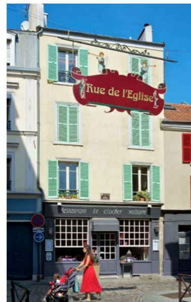
Le centre-ville historique